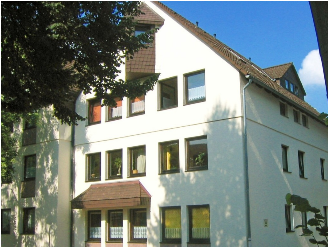
Heise Immobilien - Vermietete