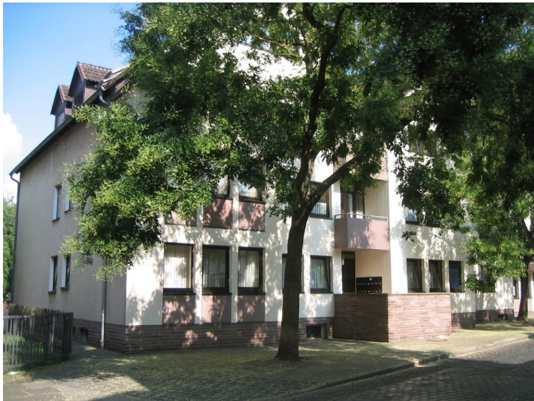
Heise Immobilien - Vermietete