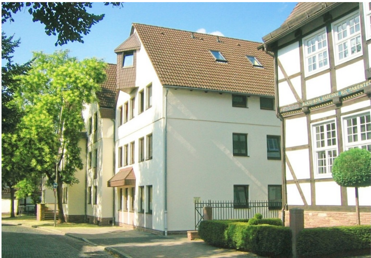
Heise Immobilien - Vermietete